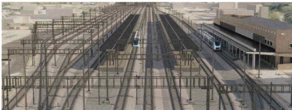
Projekt nadgradnje železniškega vozlišča na Jesenicah iz predstavitve v okviru izobraževanja

Preprečevanje nastajanja odpadkov: ponovna uporaba pragov in tolčenca. Kot primer preprečevanja nastajanja odpadkov je bila navedena ponovna uporaba rabljenih železnih pragov (obnovljeni rabljeni leseni